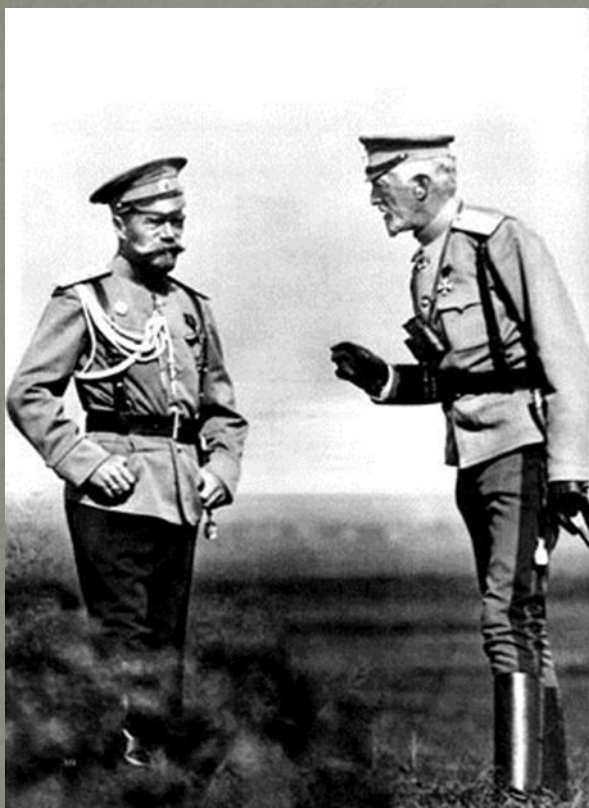
Николай Николаевич (младший). на маневрах. Красное Село. 1913.

Офицерские скачки проводились один раз в году в присутствии императора.