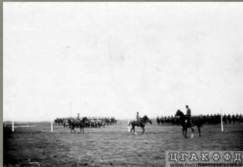
Группа конных офицеров - участников заезда (Офицерские скачки в Красном Селе), Фотография ателье Буллы, 25 июля 1913 г.