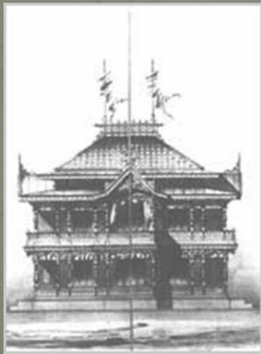
Фасад Императорского павильона. Военный инженер В.А. Колянковский. Чертеж 1892г.

Для состязания военных кавалеристов был сооружён большой скаковой круг эллиптической формы, деревянные трибуны для зрителей, царский павильон, судейская беседка, бараки-конюшни для лошадей.