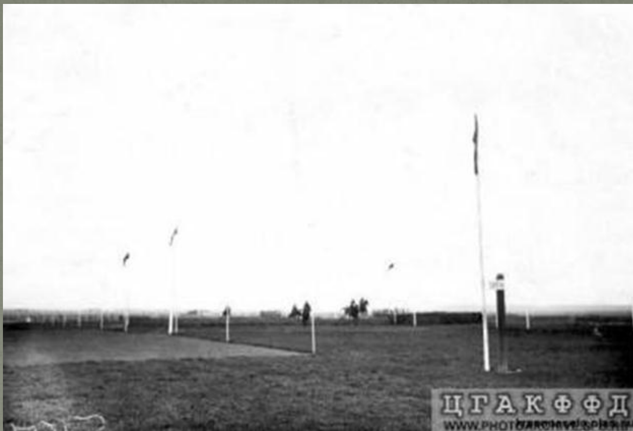
Преодоление барьера участниками скачек (Офицерские скачки в Красном Селе), Фотография ателье Буллы, 25 июля 1913 г.