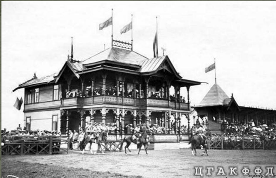
Участники скачек выезжают на старт (Офицерские скачки в Красном Селе), Фотография ателье Буллы, 25 июля 1913 г"