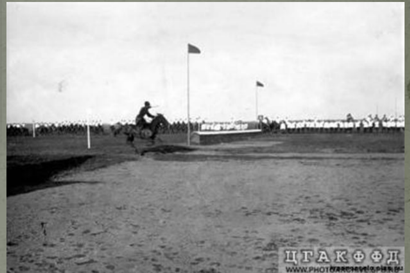
Участник скачек на дистанции заезда перед взятием препятствия (Офицерские скачки в Красном Селе), Фотография ателье Буллы, 1906 г.