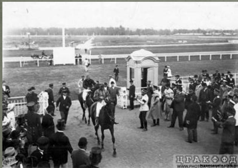
Зрители приветствуют победителей скачек (Офицерские скачки в Красном Селе)

Выходить на старт офицеры должны были в походной форме, с оружием и на строевой лошади, под обычным кавалерийским седлом, с мундштучным оголовьем.