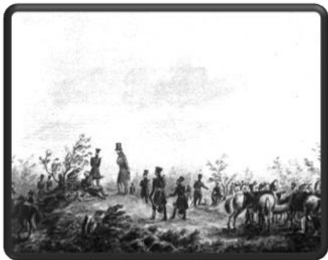
Михаил Лермонтов Бивуак Лейб-гвардии гусарского полка под Красным Селом. 1835 г.