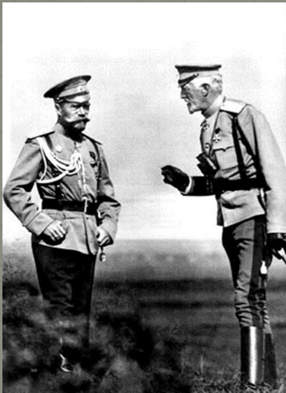
Николай Николаевич (младший). на маневрах. Красное Село. 1913.

Офицерские скачки проводились один раз в году в присутствии императора.